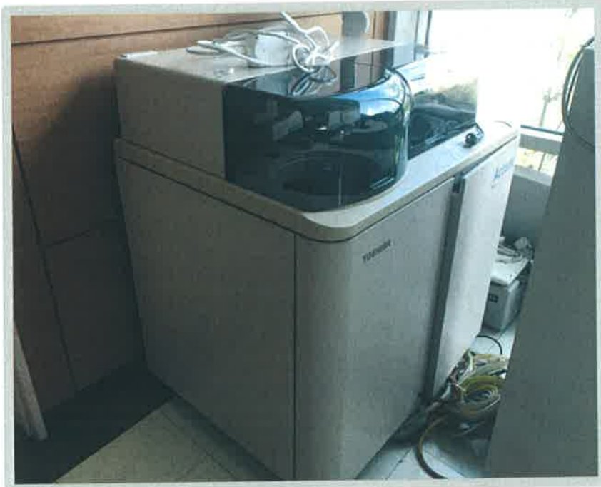
【 대상물건 기호(1) 】